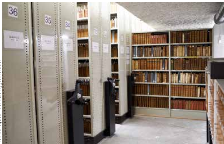
Médiathèques Roennais Agglomération