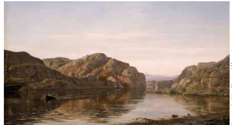
Jacques Lathion Nasjonal Museet