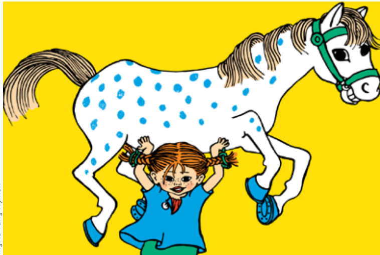
Ingrid Vang Nyman