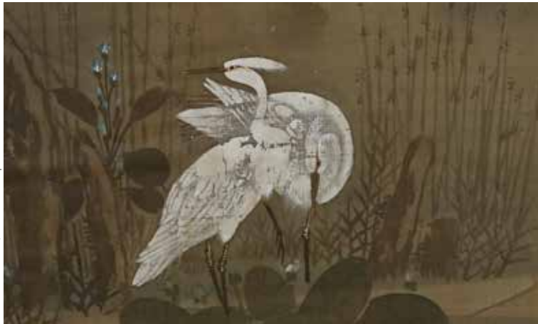
Ville de Roanne, Musée Joseph Déchelette