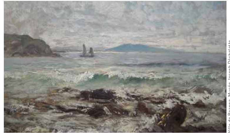
Ville de Roanne, Musée Joseph Déchelette