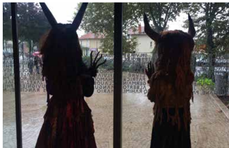
Compagnie Les Transformateurs