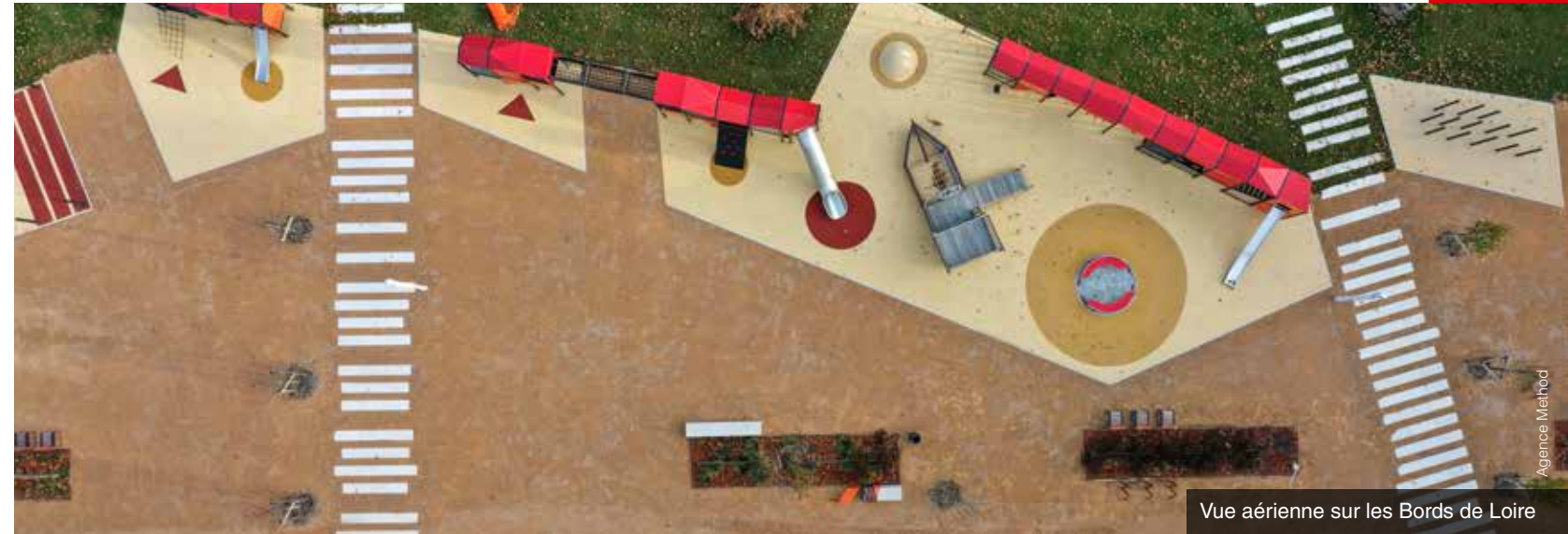
Vue aérienne sur les Bords de Loire

Mairie de Roanne : 04 77 23 20 00 Horaires d'ouverture au public : du lundi au vendredi de 8h à 12h et de 13h30 à 17h30.