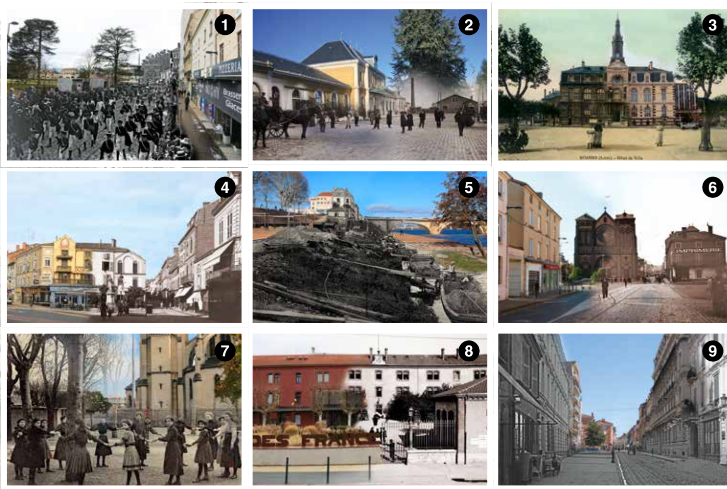
1. Place des Promenades / 2. La Gare / 3. Place de l'hôtel de Ville / 4. Taverne alsacienne / 5. Bords de Loire / 6. Église St-Louis / 7. place des Minimes / 8. Centre Pierre Mendès-France / 9. Rue Brisson