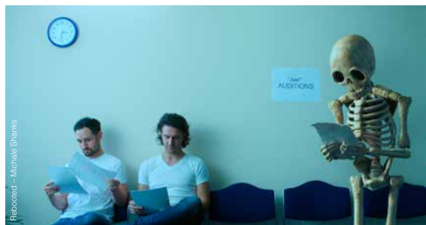
Rebooted - Michale Shanks