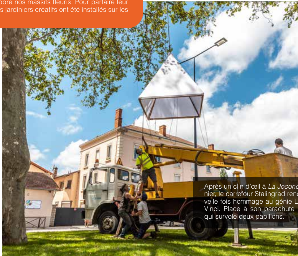
Après un clin d'œil à La Joconde l'an dernier, le carrefour Stalingrad rend une nouvelle fois hommage au génie Léonard de Vinci. Place à son parachute pyramidal, qui survole deux papillons.