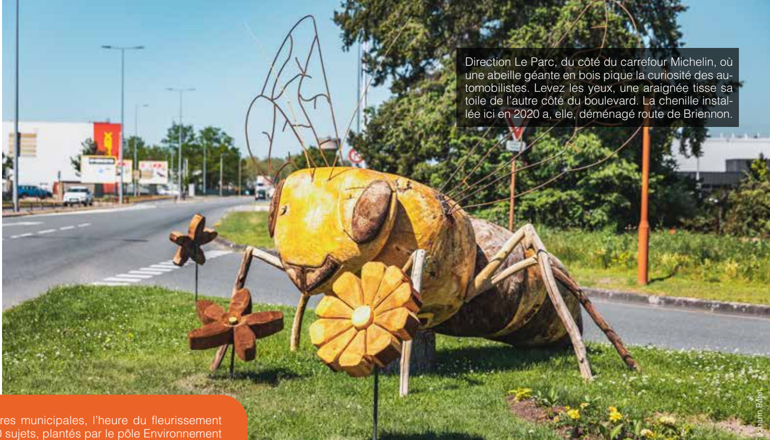
Direction Le Parc, du côté du carrefour Michelin, où une abeille géante en bois pique la curiosité des automobilistes. Levez les yeux, une araignée tisse sa toile de l'autre côté du boulevard. La chenille installée ici en 2020 a, elle, déménagé route de Briennon.

Après trois mois de culture dans les serres municipales, l'heure du fleurissement estival de la commune est arrivée ! 25 000 sujets, plantés par le pôle Environnement parmi 132 variétés, orneront jusqu'en octobre nos massifs fleuris. Pour parfaire leur éclat, de nouveaux décors réalisés par nos jardiniers créatifs ont été installés sur les entrées de ville. Bravo !