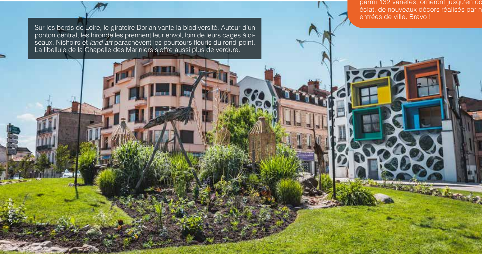
Sur les bords de Loire, le giratoire Dorian vante la biodiversité. Autour d'un ponton central, les hirondelles prennent leur envol, loin de leurs cages à oiseaux. Nichoirs et land art parachèvent les pourtours fleuris du rond-point. La libellule de la Chapelle des Mariniers s'offre aussi plus de verdure.

Après trois mois de culture dans les serres municipales, l'heure du fleurissement estival de la commune est arrivée ! 25 000 sujets, plantés par le pôle Environnement parmi 132 variétés, orneront jusqu'en octobre nos massifs fleuris. Pour parfaire leur éclat, de nouveaux décors réalisés par nos jardiniers créatifs ont été installés sur les entrées de ville. Bravo !