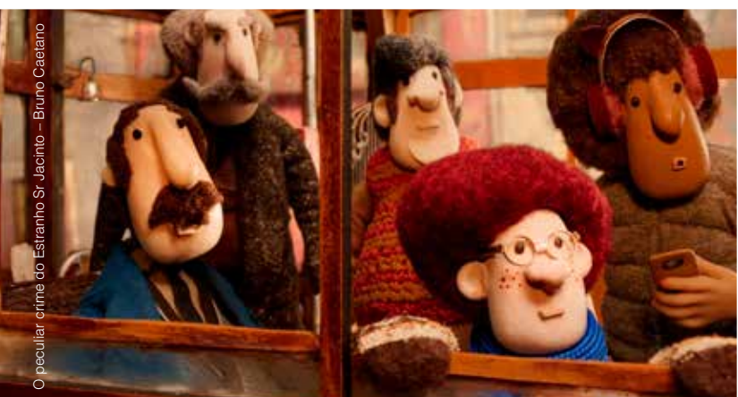
O peculiar crime do Estranho Sr. Jacinto - Bruno Caselano