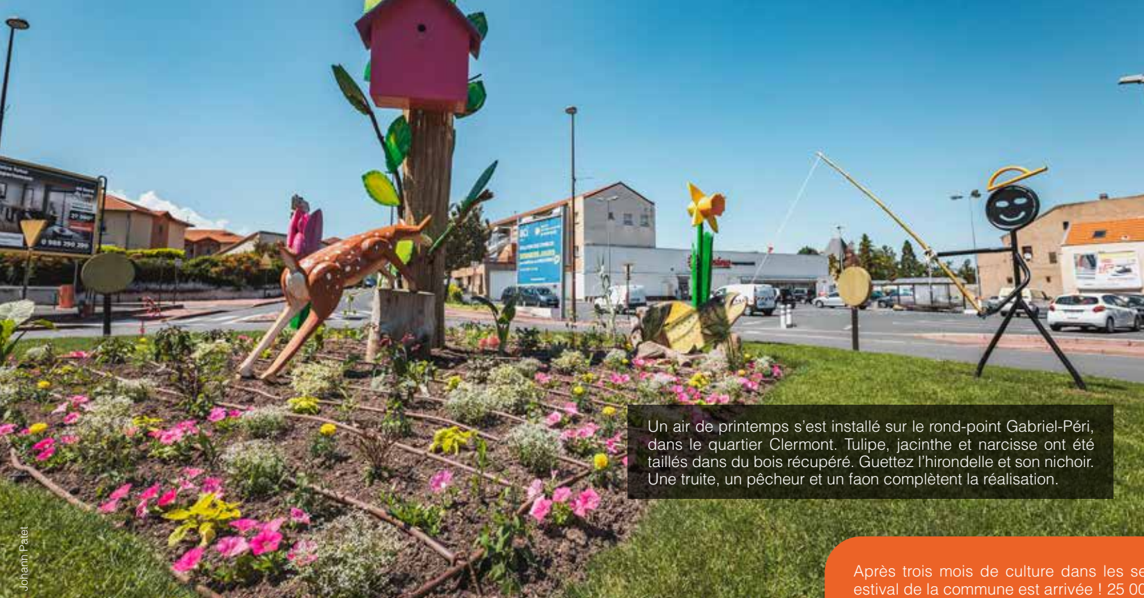
Un air de printemps s'est installé sur le rond-point Gabriel-Péri, dans le quartier Clermont. Tulipe, jacinthe et narcisse ont été taillés dans du bois récupéré. Guettez l'hirondelle et son nichoir. Une truite, un pêcheur et un faon complètent la réalisation.